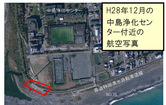
新しい堤防が航空写真でも確認できます。

工事期間中、 中島浄化センター東側市道を引き続き、工事用車両搬入路として使用いたします。 安全運転を徹底し、地域住民に配慮して走行するようにいたしますので、ご協力をお願いします。